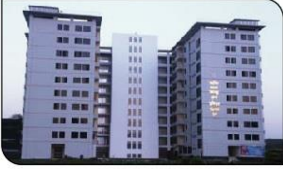
জাতির জনক বঙ্গবন্ধু শেখ মুজিবুর রহমান হল