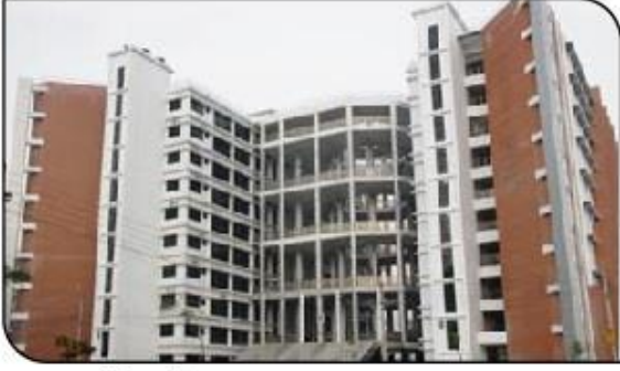
সামাজিক বিজ্ঞান অনুশদ ও ব্যবসায় প্রশাসন অনুশদ