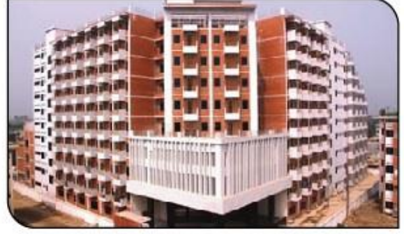
বঙ্গমাতা বেগম ফজিলাতুন্নেছা মুজিব হল